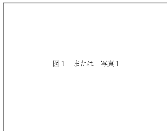
図1 または 写真1

6) 原稿を郵送する場合は、シワにならないよう厚紙等にはさんで、期日までにお送りください。