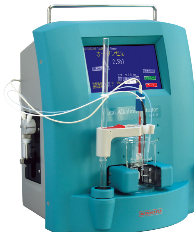
Total Alkalinity Titrator 全アルカリ度滴定装置