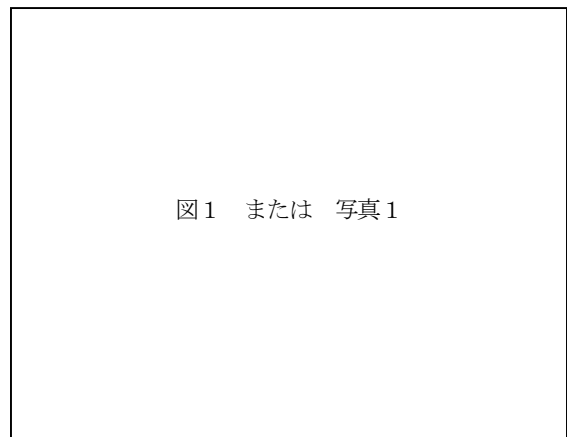
図1 または 写真1

6) 原稿を郵送する場合は、シワにならないよう厚紙等にはさんで、期日までにお送りください。